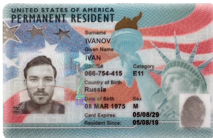
Рисунок 1. Внешний вид Грин-карты по состоянию на июль 2019 года

Способ подачи иммиграционных документов по статье «extraordinary ability» (выдающаяся личность) согласно определению в законе об иммиграции США [ 8 U.S.C. § 204.5(h)(1) ] удобен, во-первых, тем, что иммигранту не требуется искать работодателя, получать сертификацию от Бюро труда США и доказывать способность нанимающей компании платить предложенную зарплату. Во-вторых, время принятия решений по таким делам у Иммиграционной службы существенно короче, чем по делам из некоторых других иммиграционных категорий. В-третьих, все члены семьи (заявитель, дети до 21 года и супруг (-а) заявителя) по приезду в страну, получают вид на жительство в США (см. рис. 1). Для этого нужно доказать иммиграционному офицеру, что вы соответствуете требованиям, которые предъявляет закон по этой категории иммиграции.